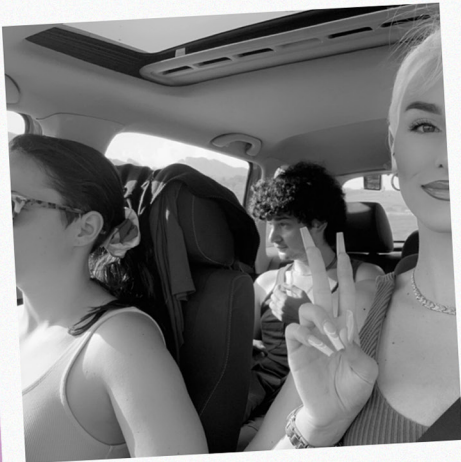
aktivistički trans kamp