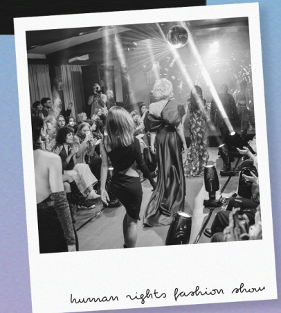
human rights fashion show

Kroz video projekat koji dokumentuje proces organizacije i realizacije Modne revije za ljudska prava (Human Rights Fashion Show), multimedijalne revije i naracije ličnih iskustava članova zajednice, uspjeli smo da usredsredimo pažnju na sve koji su događaju doprinijeli, i izrazimo zahvalnost u finalizaciji jednog od najvećih događaja godine i otvaranje Neđelje ponosa. Doseg (broj korisnika koji su sadržaj vidjeli) kampanje, prema platformi Meta Business Suite, broji 1 854 osoba .