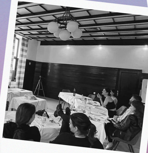
trening o zagovaranju i komunikacijama