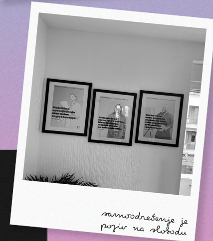
samoodređenje je poziv na slobodu