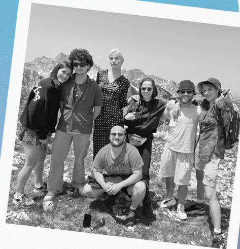
aktivistički trans kamp